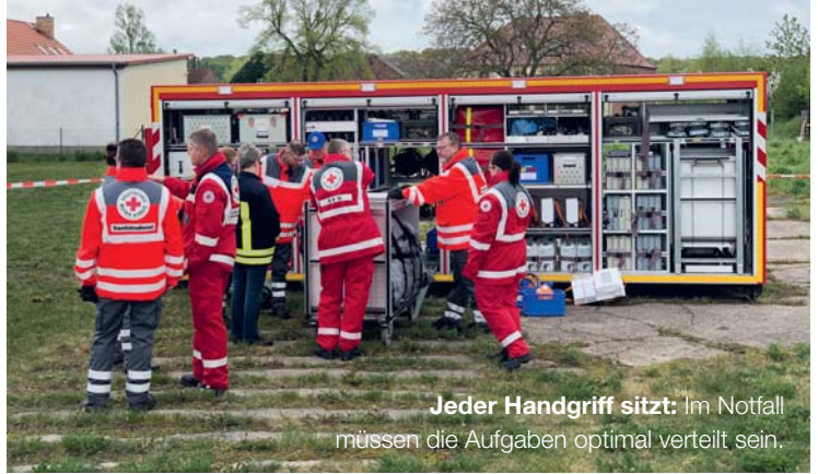
Jeder Handgriff sitzt: Im Notfall müssen die Aufgaben optimal verteilt sein.

Um den Schutz der Bevölkerung bei Katastrophen und in schwierigen Lagen zu gewährleisten, übernehmen das Land Brandenburg und der Landkreis Uckermark große Verantwortung.