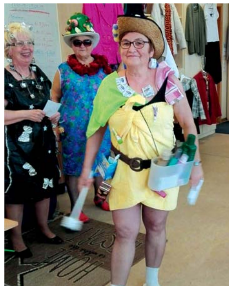
Mit Spaß dabei: In Prenzlau wurden alltagstaugliche Mode und Eigenkreationen gezeigt.