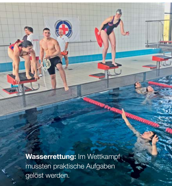
Wasserrettung: Im Wettkampf mussten praktische Aufgaben gelöst werden.