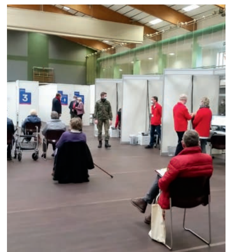
Die ersten Impfwilligen warten auf ihren ersten Pieks