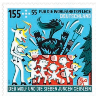
Der Wolf und die sieben Geißlein als Motiv der Wohlfahrtsmarken 2020