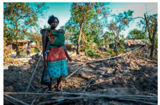
Eine Mutter mit ihrem Sohn vor ihrem Haus, das 2019 durch einen Zyklon über Mozambik zerstört wurde.

Der vollständige Bericht oder eine Zusammenfassung ist (auf Englisch) unter https://media.ifrc.org/ifrc/world-disaster-report-2020/ zugänglich. [rs]