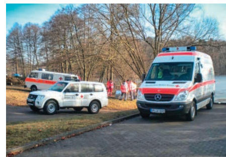
Unsere Kameraden der Wasserwacht beim Rettungseinsatz in Templin.

Wasserwacht großgeschrieben. Bevor durch die Corona-Pandemie im letzten Jahr die sozialen Kontakte eingeschränkt werden mussten, hatten wir bis zu 50 Kinder und Jugendliche in der Wasserwacht im Jugendrotkreuz. Wir hoffen, dass wir die Jugendarbeit bald weiterführen können, um hier unseren Nachwuchs für die Aufgaben in der Wasserwacht heranzuziehen. [nk]