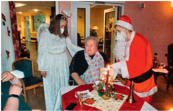
Engel und Weihnachtsmann brachten kleine Geschenke mit

Dieses Jahr ist alles anders. Es hat uns gelehrt, was wirklich wichtig ist und worauf es wirklich ankommt. Für die Mitarbeiter war es ein großes Bedürfnis, für unsere Bewohner ein besinnliches, ruhiges und festliches Weihnachten zu ermöglichen. „Können meine Angehörigen mich in der Weihnachtszeit besuchen und darf ich zu ihnen mit in die Häuslichkeit?“, waren häufig gestellte Fragen. Die Freude war dann groß, dass unter Einhaltung der Hygienemaßnahmen Besuche stattfinden konnten.