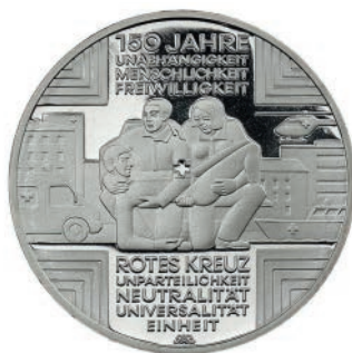
Die 7 Grundsätze auf der 10-Euro-Münze zum 150jährigen Bestehen des Roten Kreuzes in Deutschland, 2013