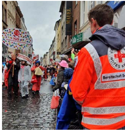
Die Lausitzer Einsatzkräfte bei der Absicherung des Rosenmontagsumzuges in Köln.

Pünktlich um 7 Uhr startete das Lausitzer Einsatzteam am Rosenmontag in die