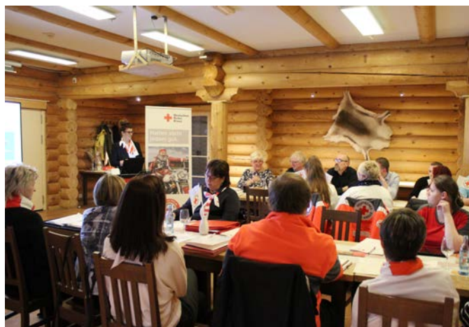
Bei der Ehrenamtskonferenz geht es um den Austausch zwischen Haupt- und Ehrenamt.

Sparkasse Niederlausitz IBAN: DE28 1805 5000 3010 0009 35 BIC: WELADED1OSL