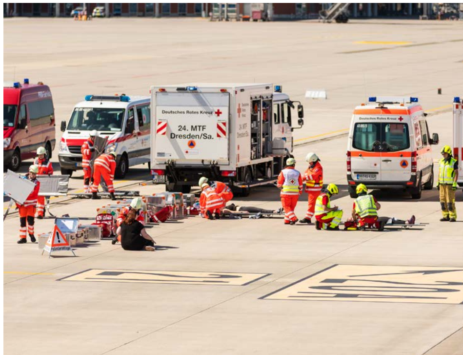
Gemeinsam bereit für den Einsatz: DRK und Feuerwehr bei einer Übung auf dem Flughafen von Dresden

Ein zusätzliches Problem sei die fehlende Geländegängigkeit der Fahrzeuge, so Gor-