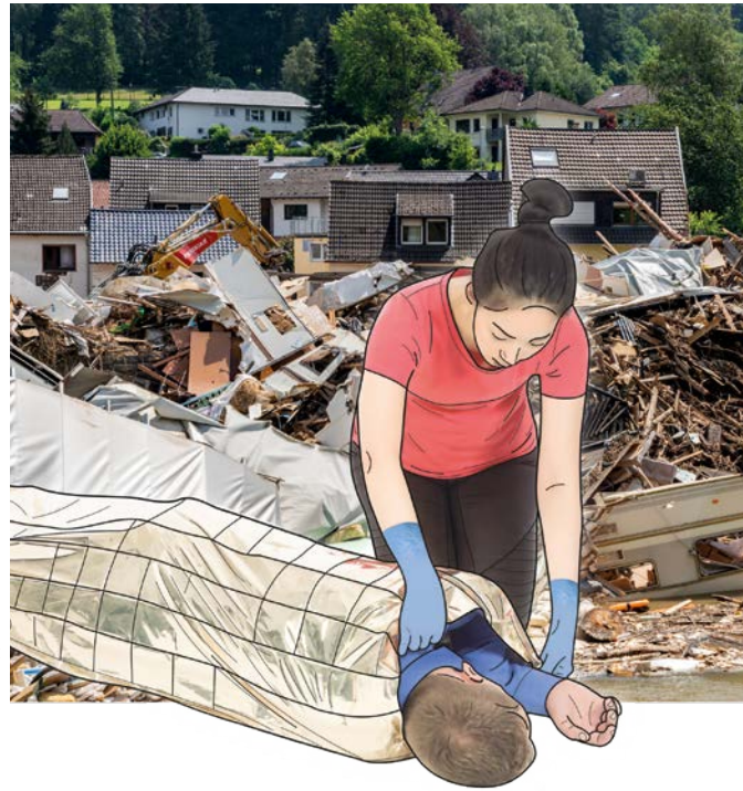
Grafik: J. F. Müller/DRKS