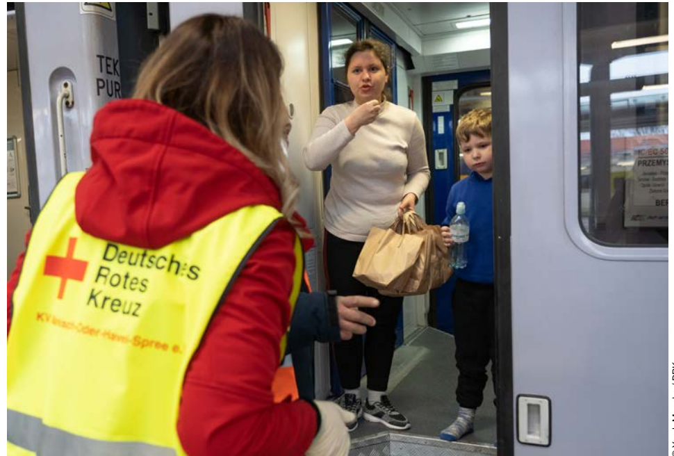
Ehrenamtliche des DRK-Kreisverbands Märkisch-Oder-Havel-Spree e.V. betreuen Geflüchtete aus der Ukraine am Bahnhof Frankfurt (Oder).

Auch während der Weiterreise in den Zügen Richtung Hannover, wo ein weiteres Dreh-