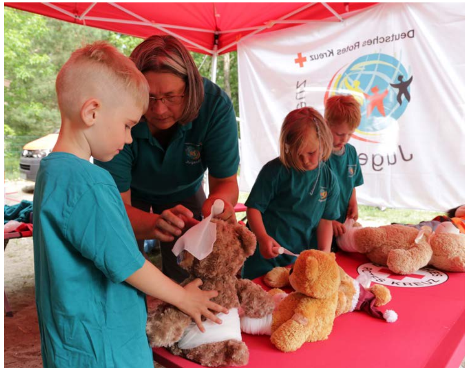
Gelebtes Rotes Kreuz: In der DRK-Kita „Wasserwichtel“ in Erkner (KV Märkisch-Oder-Havel-Spree) kommen die Kinder schon früh in Kontakt mit dem Jugendrotkreuz.

Die DRK-Kitas in Brandenburg sollen Orte sein, an denen die Werte des Roten Kreuzes