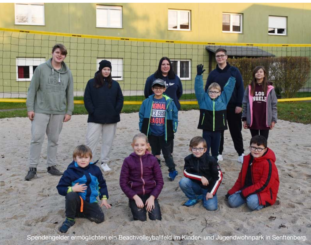
Spendengelder ermöglichten ein Beachvolleyballfeld im Kinder- und Jugendwohnpark in Senftenberg.