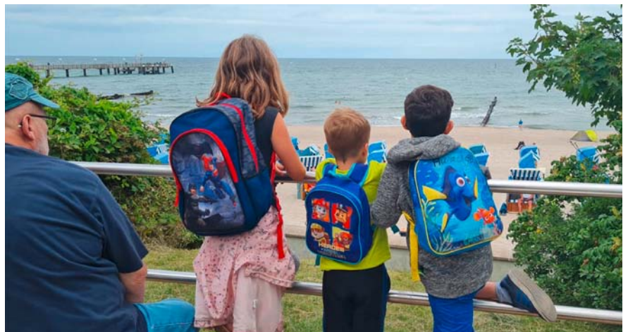
DRK-Kreisverband Lausitz e.V.

Von regionalen Märkten wurden im vergangenen Jahr Sachspenden an DRK-