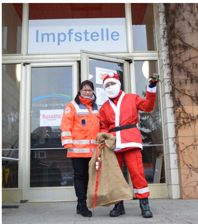
Der Weihnachtsmann besuchte die Impfstelle in Senftenberg.

Sparkasse Niederlausitz IBAN: DE28 1805 5000 3010 0009 35 BIC: WELADED1OSL