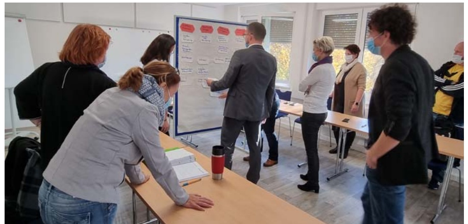
DRK-Kreisverband Lausitz e.V.

Der Prozess der Interkulturellen Öffnung und die Implementierung einer Diversitätsstrategie im Kreisverband Lausitz erfordern viel Zeit, Kontinuität, Geduld und Feingefühl. Um dieses Ziel zu erreichen, müssen geeignete Strategien entwickelt und umgesetzt werden. Dozent Csapo gab den Führungskräften Anregungen an die Hand, um den Kreisverband hin zu einem vielfaltsoffenen Verband zu entwickeln. Diese reichten von der Integration des Themas „Vielfalt“ in Aus- und Weiterbildungsinhalten über die Entwicklung einer offenen Teamkultur sowie die Nutzung von Netzwerken bis hin zur gezielten Gewinnung von Personal mit Migrationsgeschichte, insbesondere auch Führungskräfte und Schlüsselpersonen.