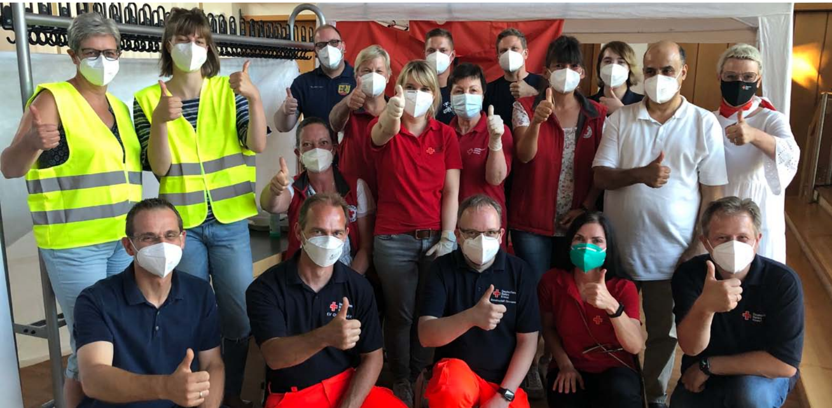
Jedermann-Impfen in Löwenberg am 14. Juli 2021