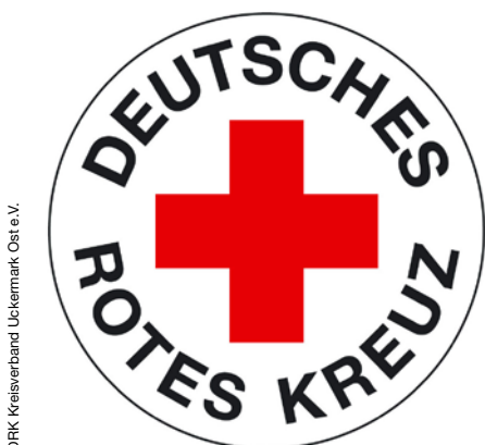
DRK Kreisverband Uckermark Ost e.V.

Die diesjährige Mitgliederversammlung unseres DRK Kreisverbandes Uckermark Ost e.V. ist für den 26.08.2021 um 18.00 Uhr im Filmforum Schwedt geplant.