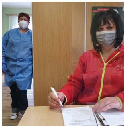
Testteam in Schwedt

„Bürgertestung“ in der Uckermark findet man auch beim DRK Kreisverband Uckermark Ost e.V. Seit dem 10.03.2021 bieten wir in Schwedt und in Angermünde im Auftrag des Landkreises Uckermark den Schnelltest - PoC Antigentest für die Bürgerinnen und Bürger an. Testen als Brücke zur Impfung ist ein weiterer Baustein, um die Pandemie endlich zu besiegen. In der DRK Geschäftsstelle testen wir in der Zeit von Mo. bis Do. von 08.00 Uhr bis 12.00 Uhr sowie von 14.00 Uhr bis 17.00 Uhr. Für Angermünde stellen wir die Räumlichkeiten der Seniorenbegegnungs-