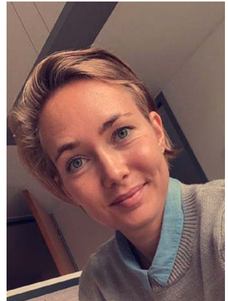
DRK Kreisverband Uckermark Ost e.V.

Ich persönlich halte sehr viel von den Teststrategien. Wenn mir durch einen